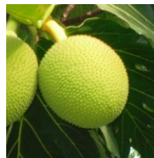
bred fruit pan de árbol