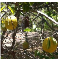
bit an suít naranja agria