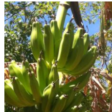
bonch a plaantin