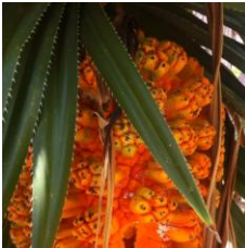
pandan/sukruu pain pandano