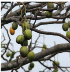
hagplom/juuplom ciruela de racimo